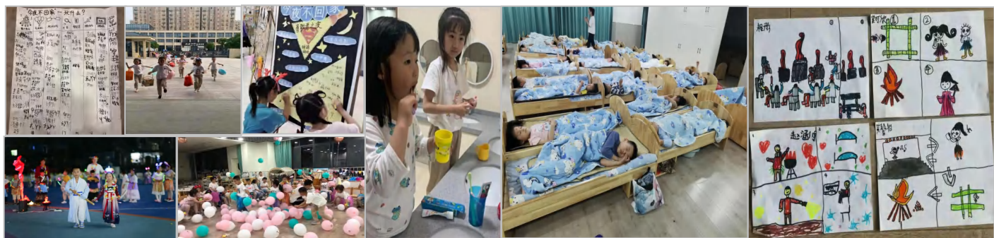
华城实验幼儿园——回味三年，不说再见