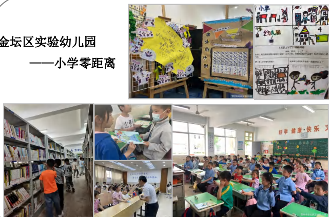
金坛区实验幼儿园 ——小学零距离

六月，褪去了最后一道挽留，把一份难舍的情结珍藏。不知不觉中，当年哭鼻子的娃娃，如今已是多才多艺的学童；往昔随意的小树，已长成了一片森林。多少个日子相伴，忘不掉的是一张张可爱的笑脸；挥不去的，是永远不变的情怀。